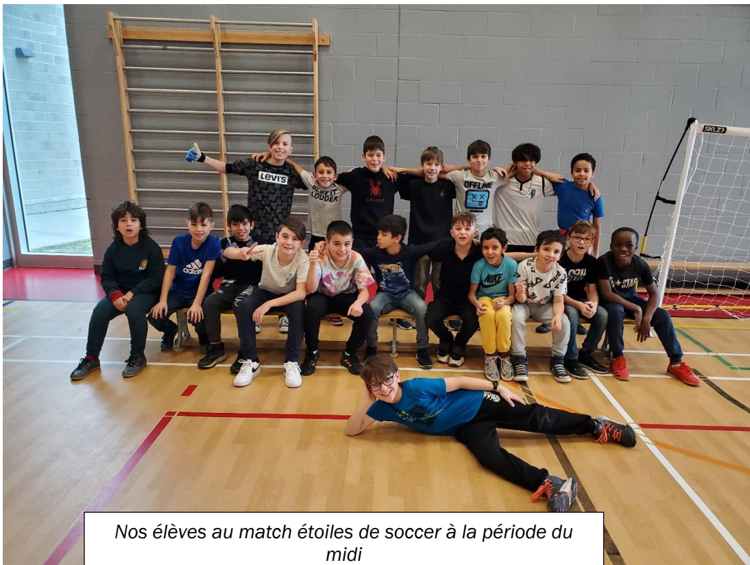
Nos élèves au match étoiles de soccer à la période du midi